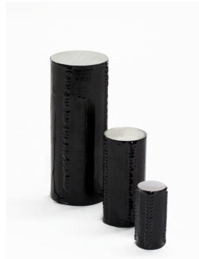
Abbildung: Stapelaktoren der Serie PSt mit verschiedenen Durchmessern und Längen